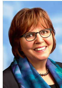
Astrid Birkhahn MdL, Beauftragte für das Ehrenamt der CDU-Landtagsfraktion

Wie kann ehrenamtliches Engagement Menschen mit Behinderung in ihrem Lebensalltag unterstützen? Wo liegen die Grenzen des Engagements? Welches Verständnis von und welche Erwartungen an Ehrenamtsarbeit haben Menschen mit und ohne Behinderung? Wie kann Politik in diesem Bereich